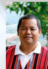
Bischof Valentin Cabbigat-Dimoc Philippinen, Apostolisches Vikariat Bontoc-Lagawe