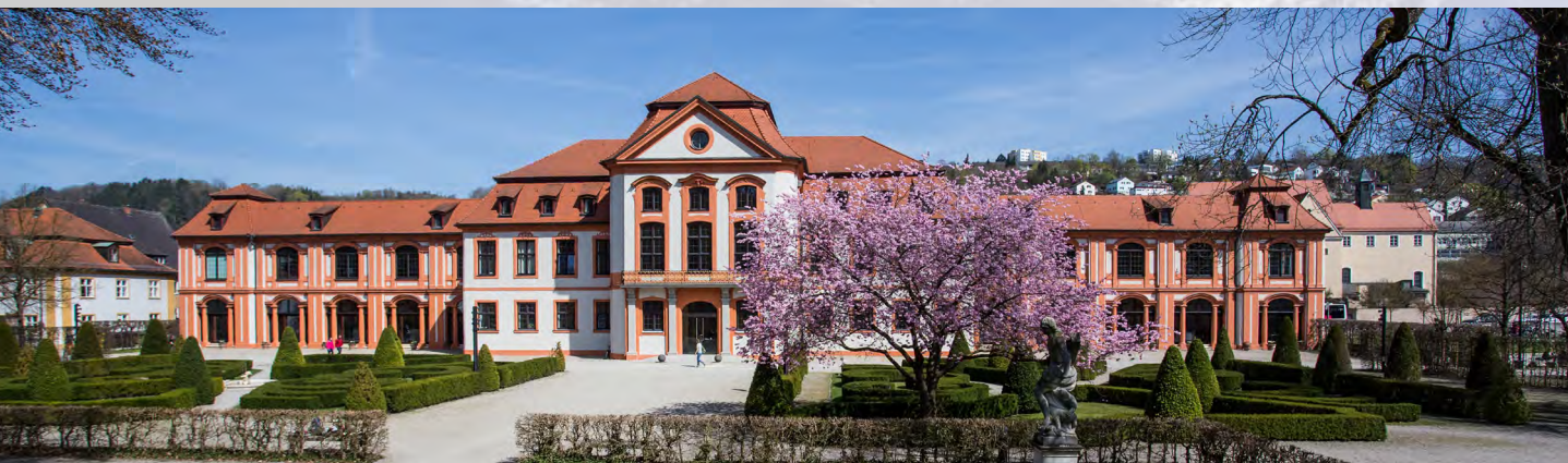
Stand: Mai 2016